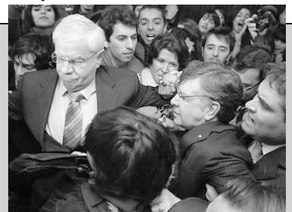
LAVIN Y LOS ESTUDIANTES

Lo bueno sería que luego de sacar las conclusiones, los que están molestos promuevan cambios de fondo y no se dediquen al cagüin barato. Para eso está la farándula.